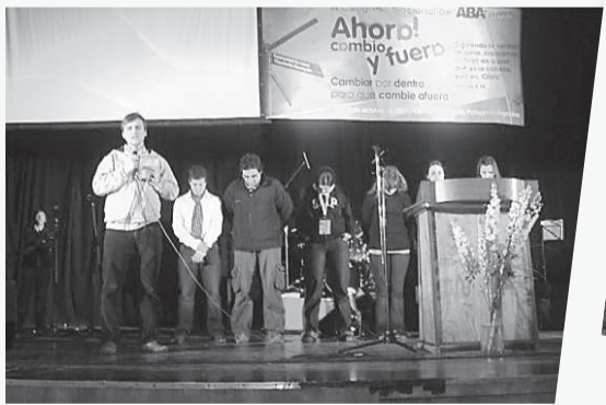
DNI, periodo 2009/2011.