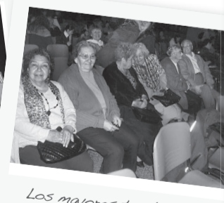
Los mayores también nos acompañaron.