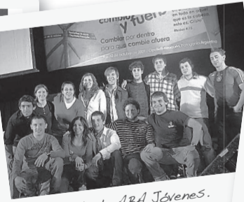
La banda de ABA Jóvenes.