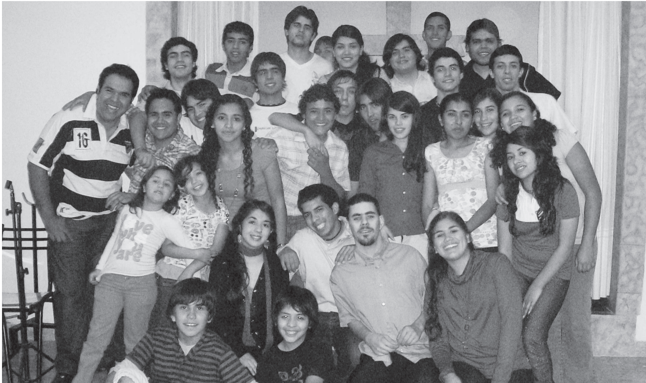
Grupo de jóvenes de Catamarca

Somos el grupo de jóvenes de la IEB de Catamarca, que se encuentra en la ciudad capital. Todos los sábados nos juntamos para compartir y aprender de la Palabra de Dios y pasar un buen momento de compañerismo.