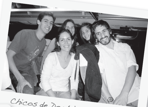
Chicos de Dominico y Ranelagh.