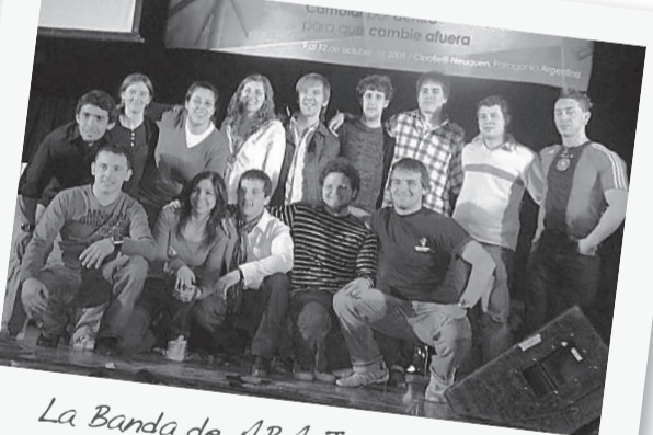
La Banda de ABA Jóvenes.