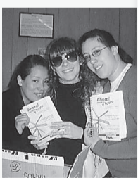
Promocionando el material del Congreso.