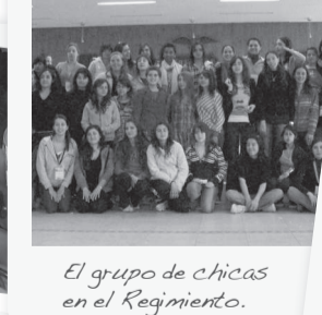
El grupo de chicas en el Regimiento.