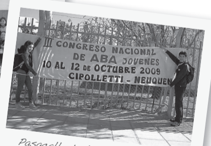
Pasacalle de bienvenida en Neuquén.