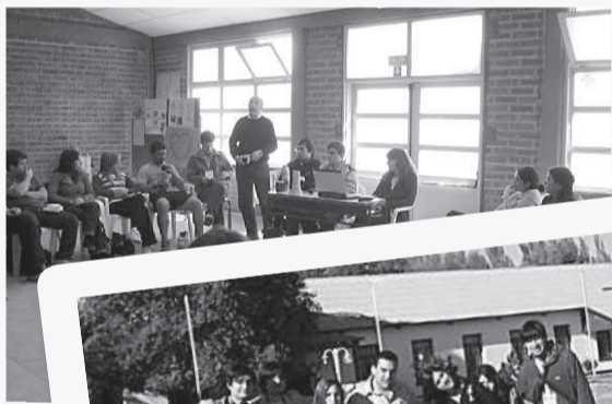
Chicos de José C. Paz.