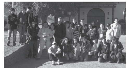
Grupo de Jóvenes de la Iglesia Bautista de Esquel

DNI: ABA Jóvenes. jóvenes@bautistas.org.ar