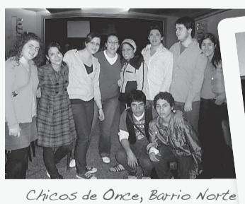
Chicos de Once, Barrio Norte y Dominico.