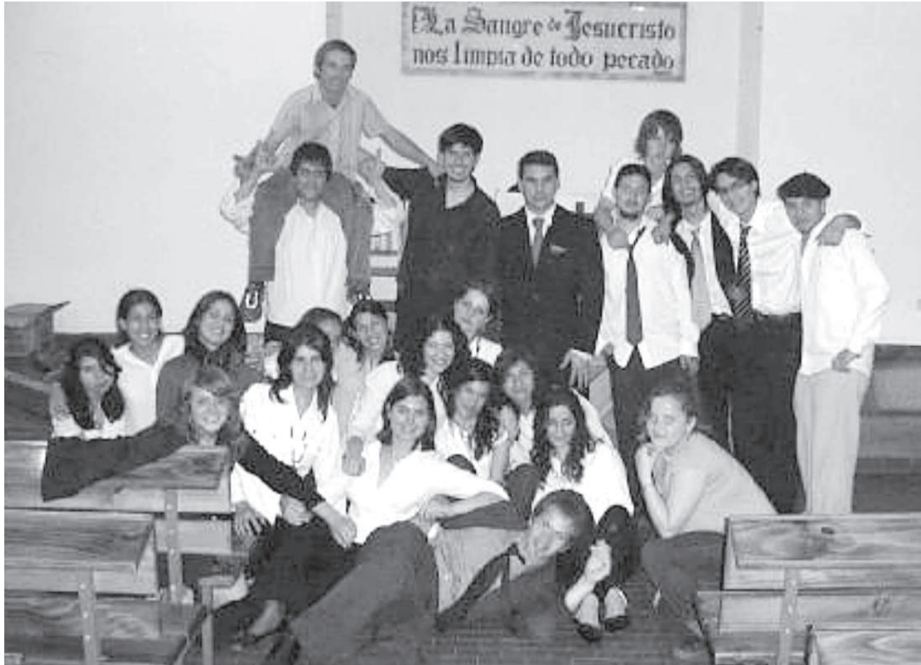
Los chicos de José C. Paz en una reunión en su Templo.

Somos el grupo de Jóvenes de la I. E. B. de José C. Paz. Nos reunimos todos los sábados a las 17 Hs para jugar al volley, tomar mate, contarnos cómo nos fue en la semana, pero sobre todo para estudiar la palabra de Dios y lo que Él tiene para nuestras vidas.